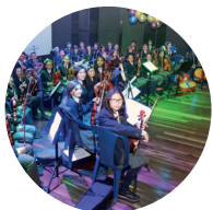
Compra de instrumentos para a orquesta sinfónica