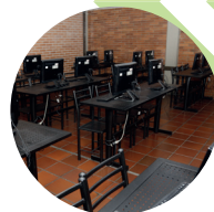
Renovación de equipos en salas de tecnología