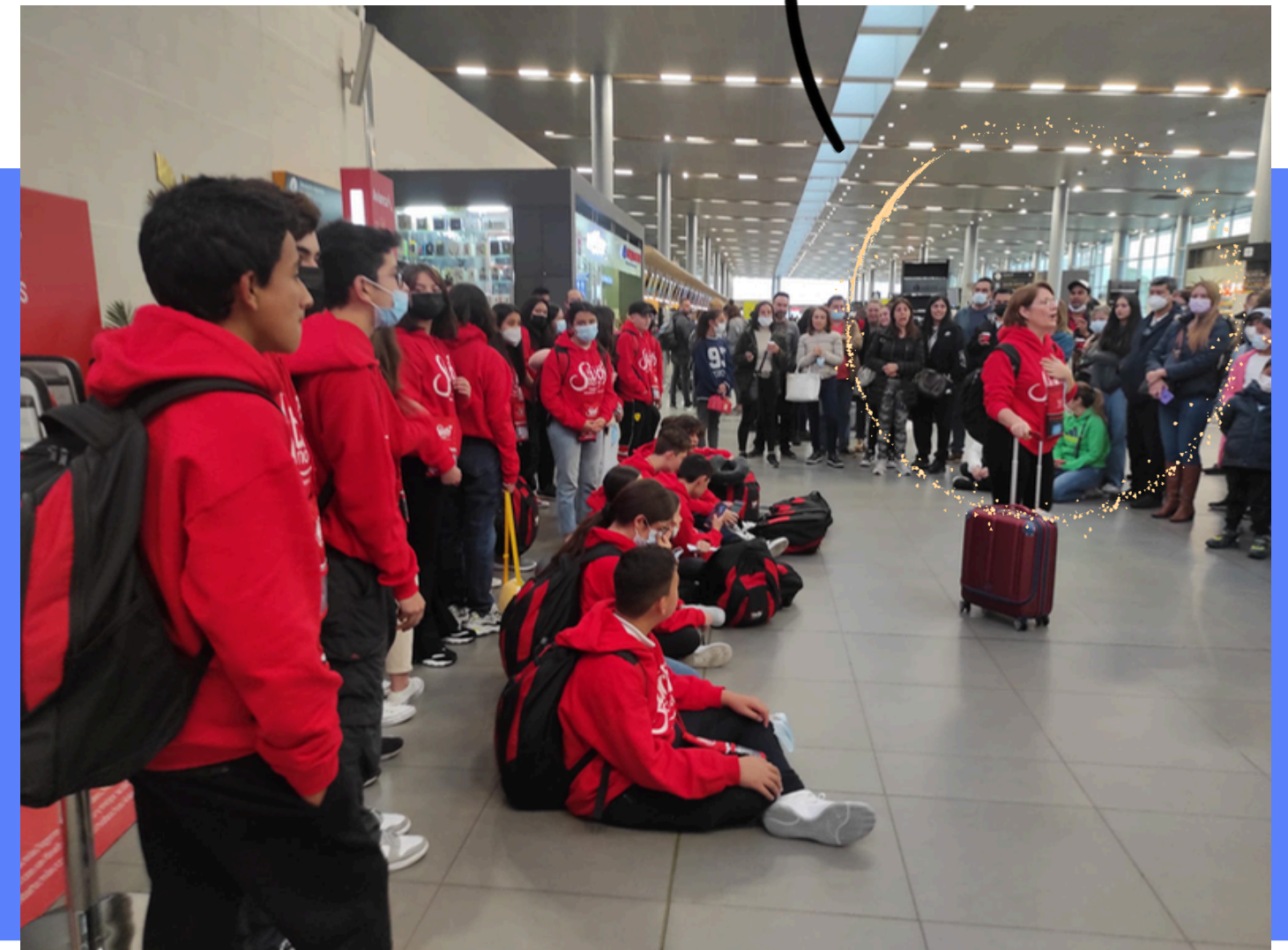
Equipo del Staff para preparación de los grupos.